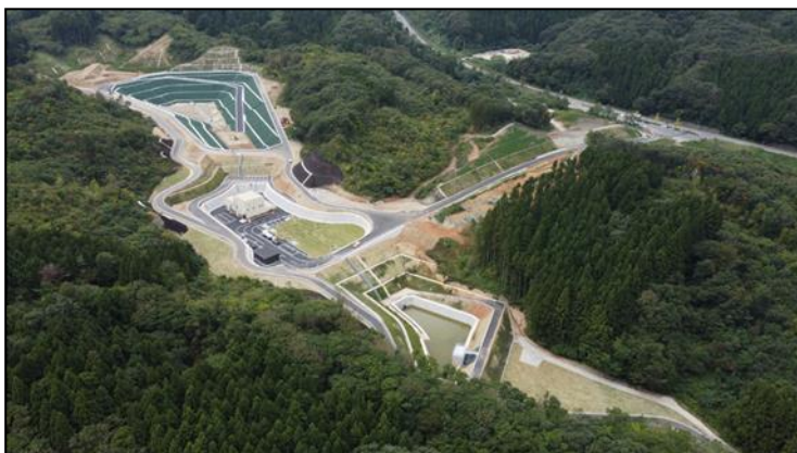
鶴岡市一般廃棄物最終処分場