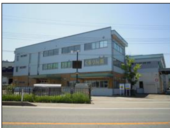
リサイクルプラザ