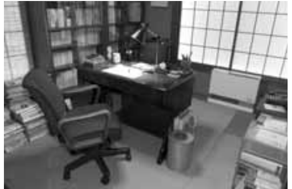
館内に移築再現された書斎

所在地 鶴岡公園内 入館時間 午前9時～午後4時30分(受付終了) 休館日 月曜日(祝日の場合は次の平日) 入館料 大人300円、高校生・大学生200円、 中学生以下無料