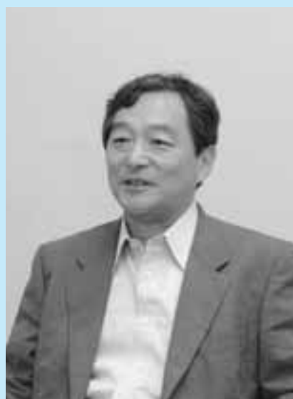
中央大学文学部教授。専門は家族社会学で、親子・夫婦・恋人などの人間関係を社会的に研究している。「パラサイト・シングル」「婚活」という言葉を生み出し、「婚活」という社会現象に大きな影響を与える。講演のため来鶴。東京都出身。