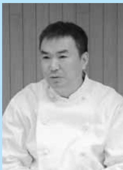
映画監督。大阪芸術大学在学中に映像制作を始め、現在まで『村の写真集』『しあわせのかおり』など多くの作品を手掛ける。特技は料理(特に中華)。映画と食のイベントに参加するため来鶴。京都府出身。