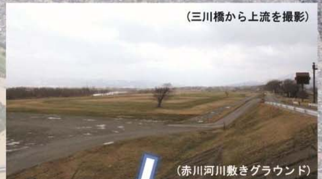
（赤川河川敷きグラウンド）