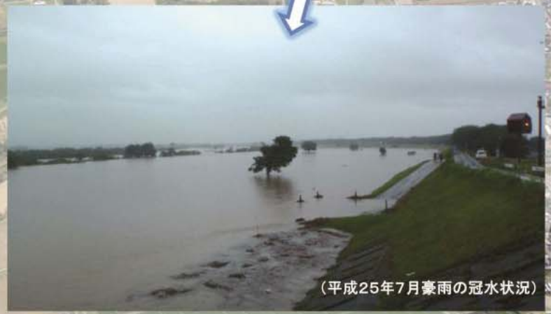
（平成25年7月豪雨の冠水状況）