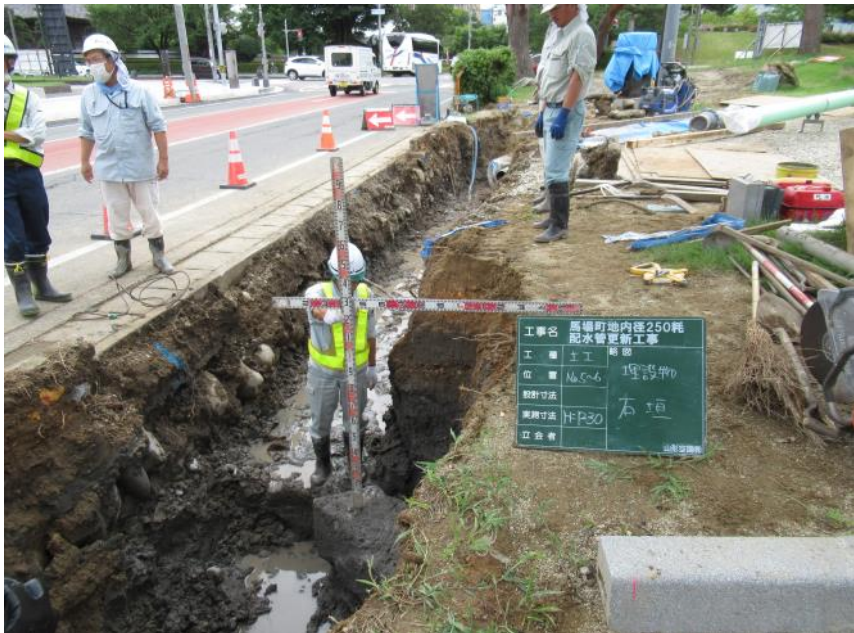
工事区全景（北から）