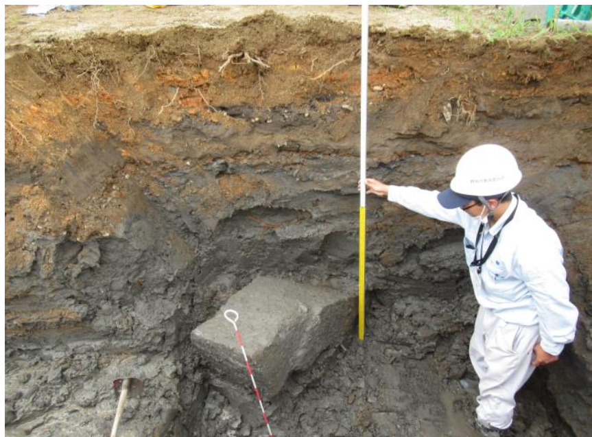
石垣検出状況（東から）