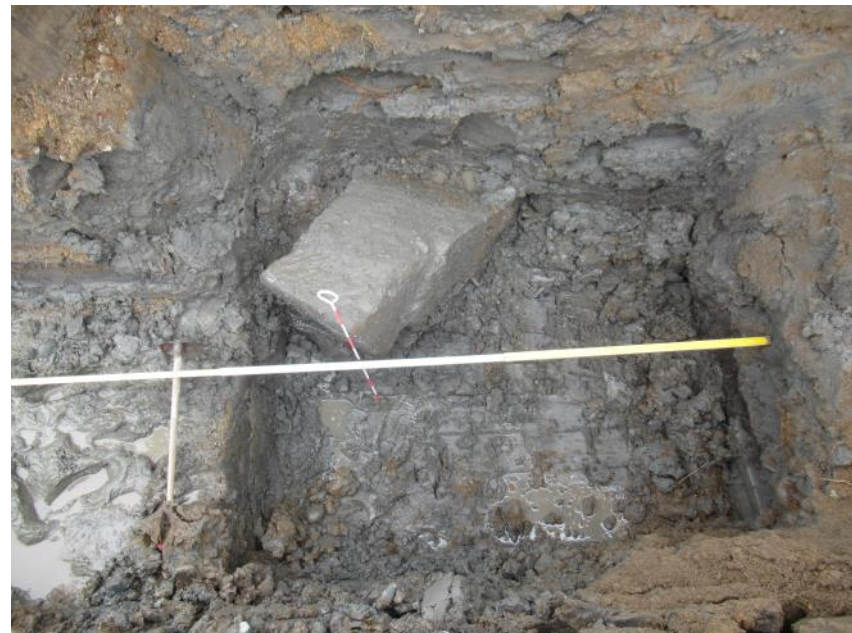
石垣検出状況（東から）