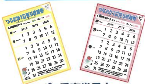
= バス乗車券見本 =