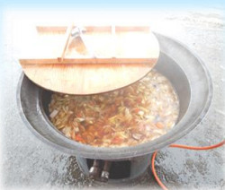
雪まつり名物カモ汁。 あったまります。

カモ汁、豚汁、玉こんにゃく、 みそ焼きおにぎり、そのほか 屋台フード色々。 行沢のあん入りとちもち、 山ぶどうサイダーなどの 特産品販売もあります。