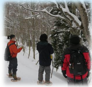
スキー場の林の中に入って自然観察ができます